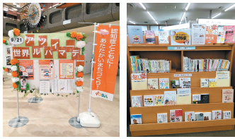
昨年の啓発展示の様子