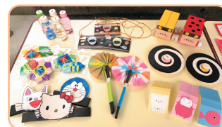
手づくりおもちゃの一例