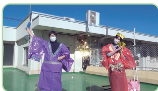
ひなまつりイベントの配信

登園や外出を自粛している家庭に向け、保育園での遊びを自宅でも楽しめるような動画や、普段の園での様子をYouTubeに配信しました(在園児限定で公開)。