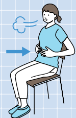
呼吸練習 腹式呼吸の指導

また、適切な診療に結びつけるため、県が指定した後遺症外来設置医療機関との連携を図りながらフォローアップ体制を構築していきます。