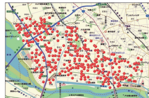
見守り防犯カメラ設置場所

市内全12小学校区に見守り防犯カメラの整備を行い、令和3年4月から300台の見守り防犯カメラの運用を開始しました。警察などの捜査機関からデータ照会があった時のみ映像の確認および提供を行っています。また、防犯カメラの稼働と併せて、位置情報検知機器を活用した子どもの見守りサービスも開始しています。