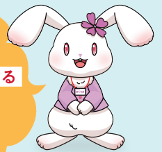
デジタル職員 さくざちゃん