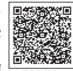
厚生労働省 ホームページ

スマートフォンの近接通信機能(Bluetooth)を利用して、プライバシーを確保しつつ、通知を受けることができます。利用方法など、詳しくは右のQRコードからご確認ください。