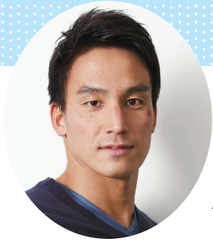
オリンピック競泳 メダリスト 松田丈志さん