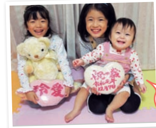
一歳の誕生日を 一升餅で お祝い♥