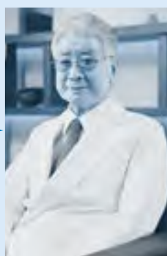
戸田中央総合病院グループ会長

皆さんは、誰でも素晴らしい可能性をもっています。学ぶことによって、その可能性を広げてください。元氣と勇気を持って世界へ、未来に向かって大いに羽ばたいてください。この制度は、皆さんのお役に立つと思います。私は全力を挙げて応援しています。