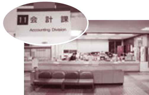
会計課：11番窓口。市役所2階正面玄関入ってすぐ左。

なお、会計課では、収入印紙に加え、埼玉県収入証紙も取り扱っているため、埼玉県収入証紙と誤って購入することがないように、購入前に今一度ご確認ください。