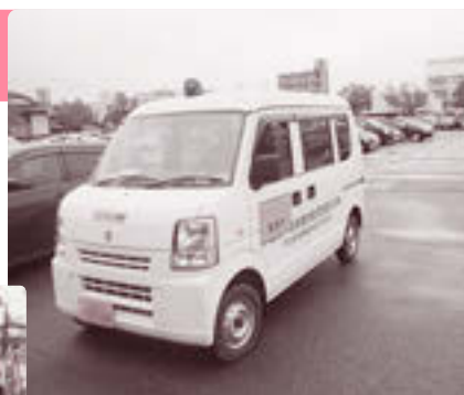
提供車両のイメージ

市では、これまで事業者の自主防犯活動団体を募集し、青パトによるパトロールを推進してきました。そして、平成29年度から、さらなる青パトの普及を図るため、青パトバンク制度を開始しました。これは、車両を所有する事業者から車両の入替や廃車予定などの情報を提供いただき、青パトによるパトロールを始めたい団体に提供する制度です。提供できる車両の情報、パトロールを開始したい自主防犯団体の皆さんの申し込みや相談をお待ちしています。