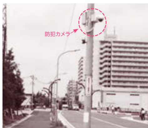
北部橋付近の防犯カメラ