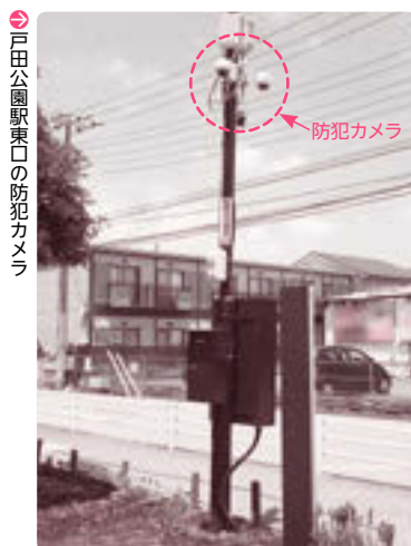
戸田公園駅東口の防犯カメラ

平成29年度から3年間、1町会3台を上限として、町会・自治会が設置する防犯カメラに対し、市が1台につき40万円まで補助する制度を開始しました。これにより、本年度中には73台の防犯カメラが市内に設置されることとなります。