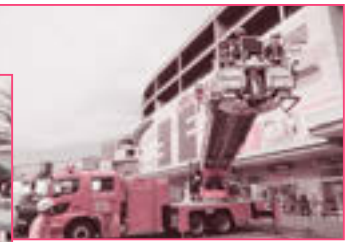
▲毎年大人気のはしご車体験試乗