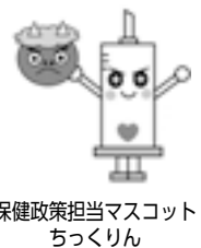
保健政策担当マスコット ちっくりん

※現在、子宮頸がんワクチンは厚生労働省の勧告により、積極的な接種勧奨を控えています