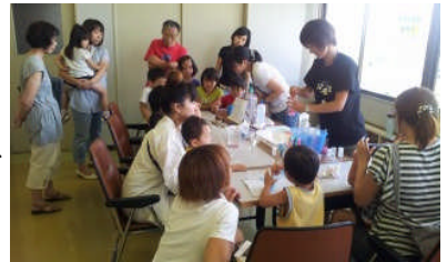
H24 彩湖 わくわくウィーク

さて、戸田市広報7月1日号の特集記事でも紹介 しょうかい しましたが、センターでは、子どもたちの自由研究のヒントになる講座 こうざ を計画しています。まず、7月26日には、芦原小学校で行われる「サイエンスフェスティバル」で万華鏡とネイチャークラフトの教室を開きます。また、8月3日～6日には、「彩湖 わくわくウィーク」を行います。詳しい内容につきましては、右ページをご覧 らん 下さい。8月10日には、毎年恒例の自然観察会「夜のいきものたち」を行います。8月25日(日)には、「親子星空観察会」を行います。その他にも夏休み期間中に「とだミュージアムラリー」(クイズに正解した方に抽選 ちゆうせん でオリジナルグッズをプレゼントします。)を行います。ぜひ、センター講座等に参加して、夏休みの自由研究のヒントにして下さい。(T)