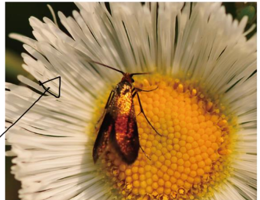
ハルジオンにとまるメス