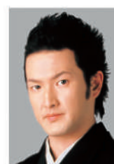
なかむら しどう 中村 獅童