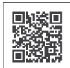
スポーツセンターHP