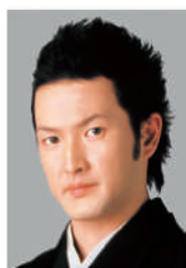
なかむら しどう 中村 獅童