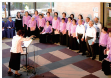
2019年7月28日(日) 出演:宝珠コーラス、コール・セプテンバー