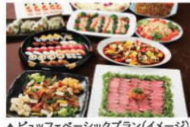
▲ビュッフェベーシックプラン(イメージ)

プチケーキ&フルーツ盛り合わせ ※メニューは季節により変更となる 場合がございます。