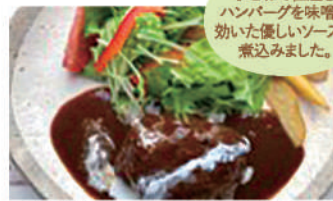
▲味噌デミグラスハンバーグ定食 1,100円