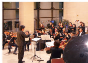
2023年12月3日(日) サロンコンサートvol.74