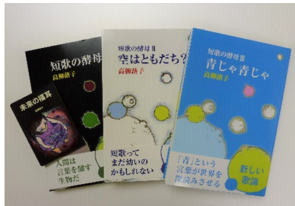
短歌評論集「短歌の酵母」・豆本歌集「未来の福耳」