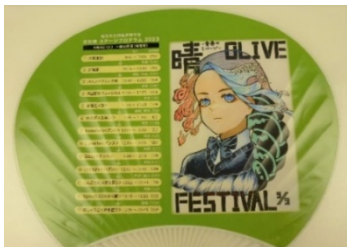
文化祭案内うちわ

文化祭では、各クラスの出し物や各部活の発表、ステージプログラムが開催され、一般来校者や保護者の方々が大変にぎわっていました。