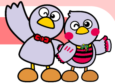
埼玉県マスコット「コバトン」「さいたまっち」