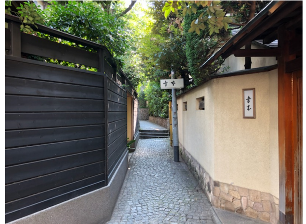
・昔ながらの石畳が残る「兵庫横丁」