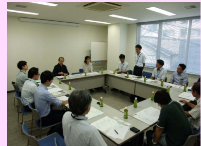
・視察での話し合いの様子

→実際にイベントは数多く行われています。商店会や地元のNPO等それぞれの団体がそれぞれのイベントを行っています。