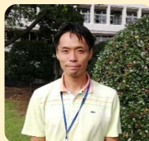
まちづくり推進課 亀田主任

①まちづくりの意気込み 戸田公園駅西口駅前地区を 活気あふれるまちにしてい くために尽力していきます ので、よろしく願います。