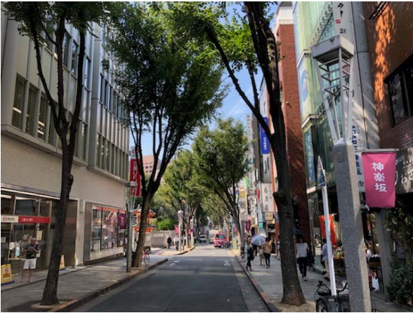
・建物がきれいに並んでいる「神楽坂通り」

神楽坂地区のまちづくりを先導している「神楽坂通り商店会」の役員と新宿区の景観・まちづくり課の方々より神楽坂のまちづくりの経緯や取組の状況、組織等について説明をしていただきました。また、参加者との質疑応答も行いました。