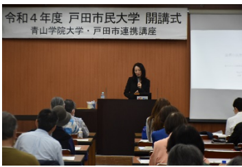
「青山学院大学連携講座」

青山学院大学、埼玉大学等と連携した講座を実施しています。各大学の最先端の研究成果に触れることができる講座です。