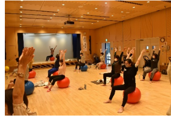
「家族で取り組む産後ケア」