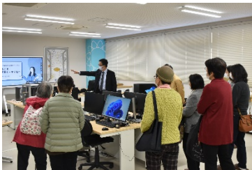
「戸田市の教育を知ろう！」 (戸田東小・中学校の見学)