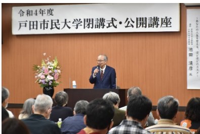
「がんばらない生き方」