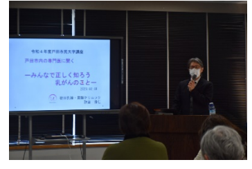
「戸田市内の専門医に聞く～ みんなで正しく知ろう乳がん のこと～」