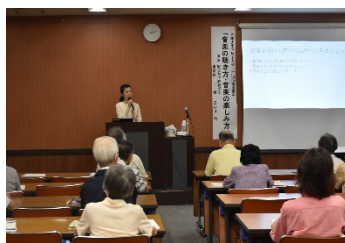
「埼玉大学連携講座」