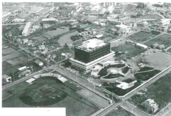
市庁舎空撮(昭和45年)