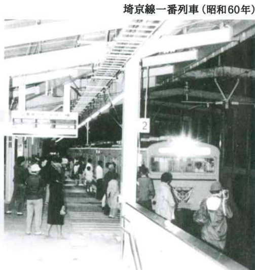
埼京線一番列車(昭和60年)