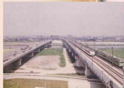
国道17号線 (東京方面より戸田方面を望む) (昭和61年)