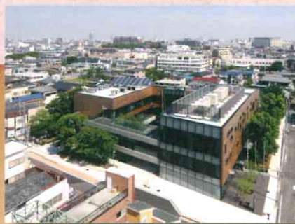
旧戸田町役場本庁舎跡地に建つ「あいバル」 (平成27年)