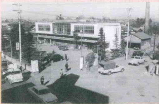
戸田町役場本庁舎 (昭和40年)