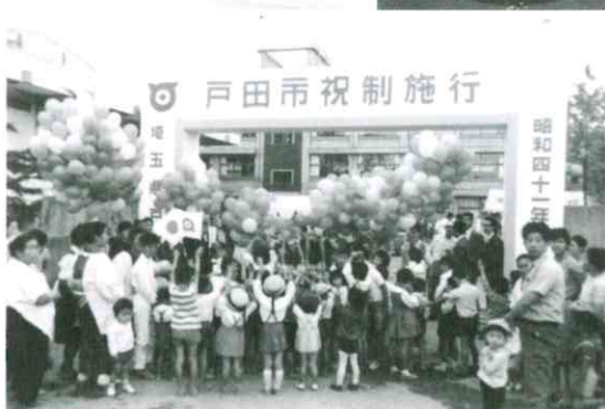
市制施行祝賀行事 (昭和41年)