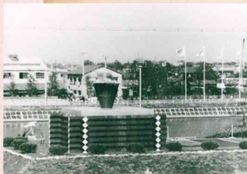
東京オリンピック開催時のボートコース聖火台 (昭和39年)