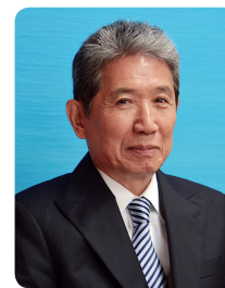
戸田市長 神保 国男

戸田市位于埼玉县东南部，在江户时代，中山道的“戸田之渡”曾设在这里，作为交通要道繁华一时。另外，这里还有曾在1964年东京奥运会中举办过划艇比赛的“戸田划艇赛道(戸田漕艇场)”，以及年到访人数在100万以上的“彩湖道满绿色公园”等风景宜人之地，是一个林青水秀的绿洲城市。戸田市于1966年建市，是埼玉县内所设置的第24座城市。今年10月，本市将迎来建市50周年。与当初相比，本市的人口已达到2倍以上，预期今后还将继续增长。此外，人口的平均年龄在县内也是最年轻的，加上交通网络的发达便利，各项产业也蓬勃发展，可谓地利人和，未来的可持续发展潜力巨大。本《市政要览》概括介绍了戸田市的现在、过去和未来前景。希望您能够从阅读中对本市有所了解，我们将深以为幸。