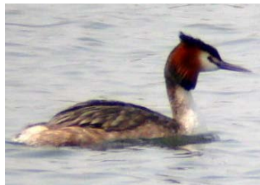
カンムリカイツブリ