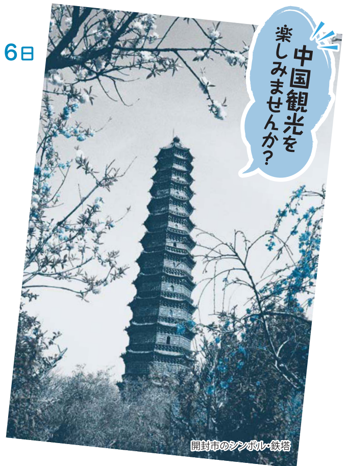
開封市のシンボル・鉄塔