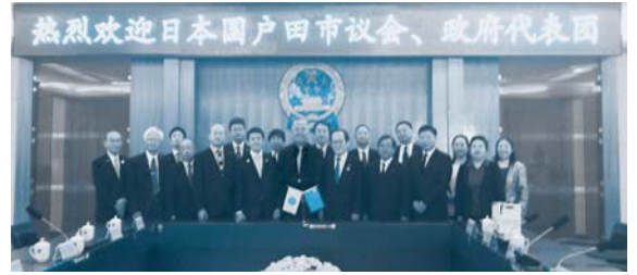
平成30年 市友好代表団 開封市訪問

市と中国開封市は昭和59年に友好都市を締結しました。開封市とは、友好代表団や青少年代表団の相互訪問などを通して交流しています。8月には、友好都市締結35周年を記念して、開封市友好代表団の来訪が予定されているほか、下記のとおり市民訪問団の派遣を予定しています。