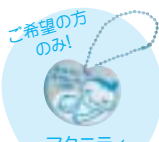
マタニティキーホルダー